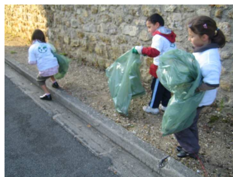
Quelques élèves en pleine action...